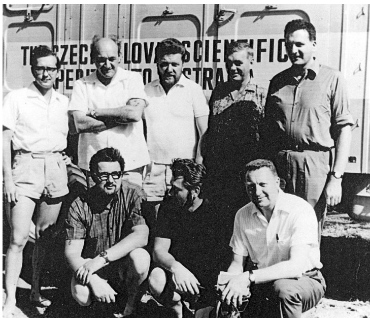
Členové expedice těsně před startem